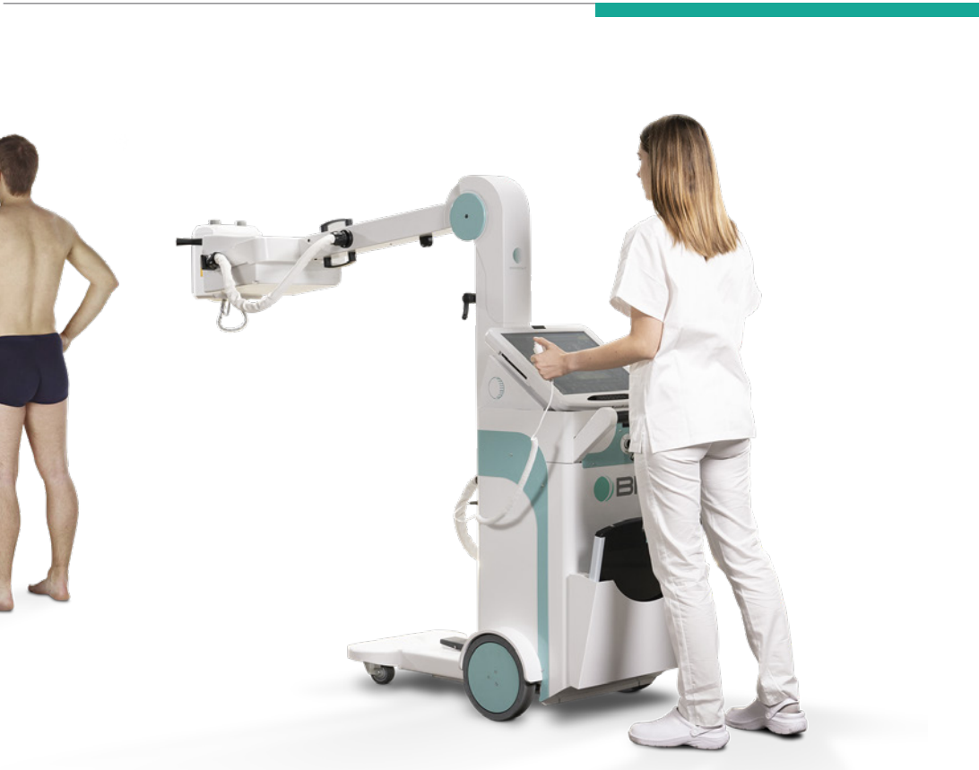
Routine Chest examinations | Examens thoraciques de routine