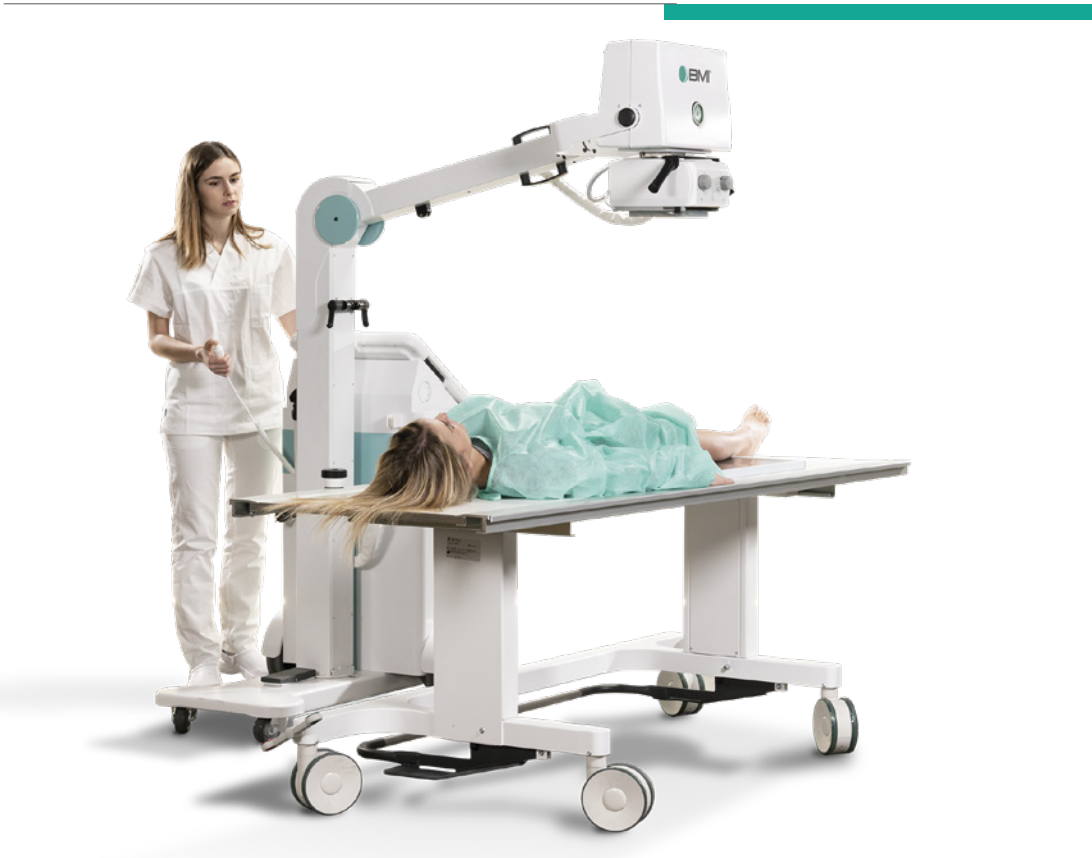
Emergency Imaging | Imagerie d'urgence