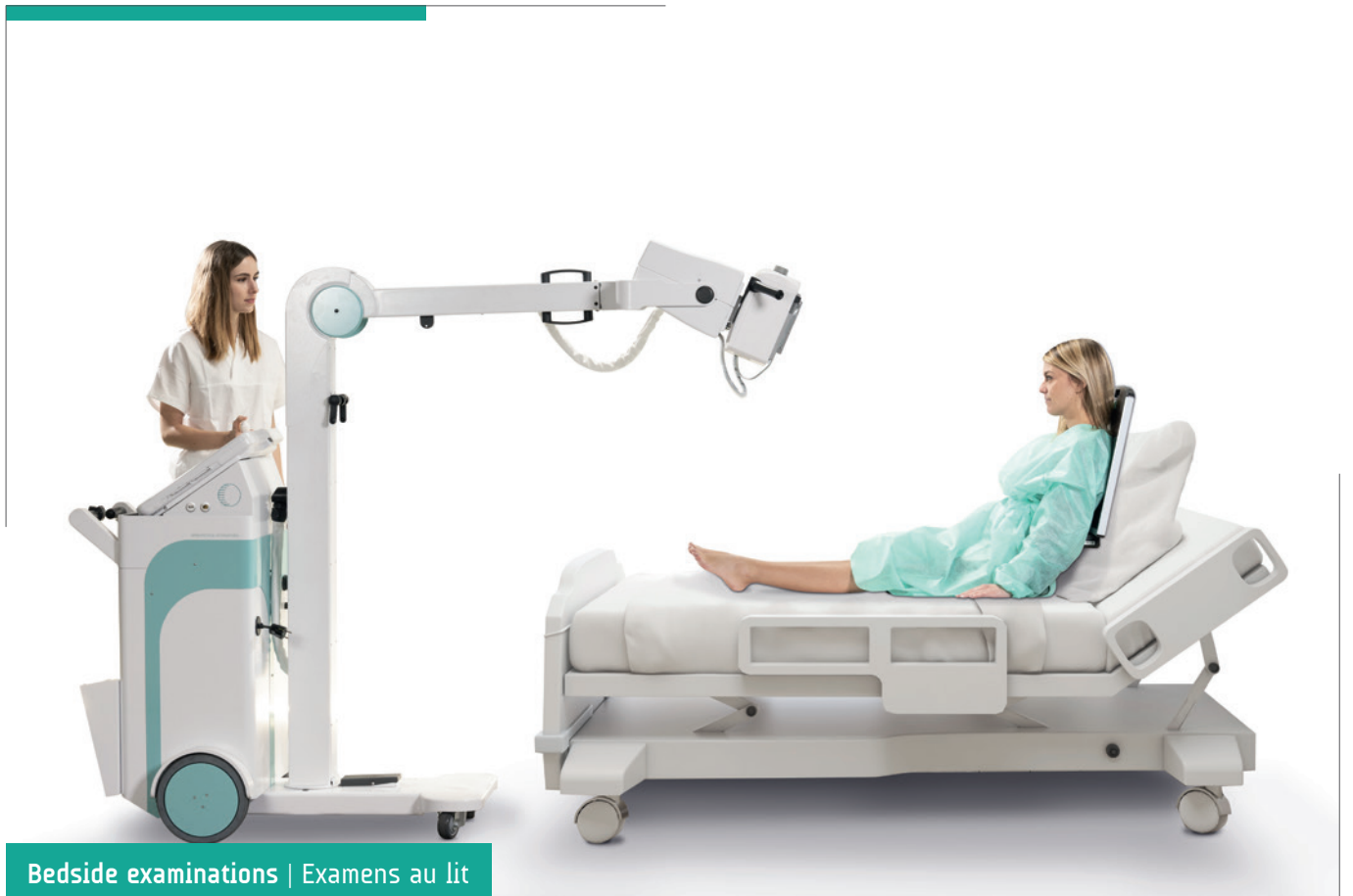
Bedside examinations | Examens au lit

Idéal pour une large gamme d'examens diagnostiques dans tout environnements sanitaires.